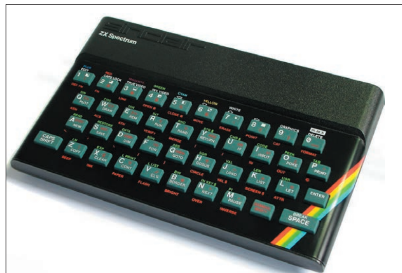
Figura 2. Ordenador Sinclair ZX Spectrum (1982).