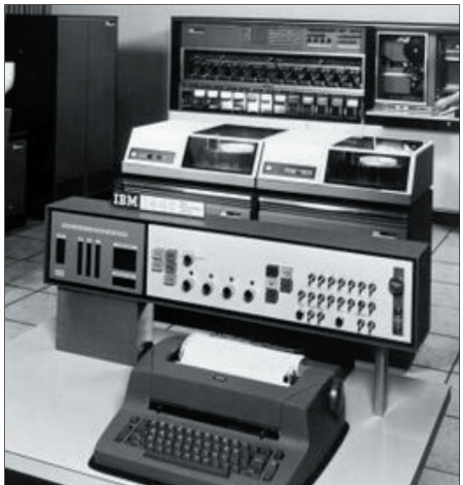
Figura 3. IBM 1440 (1962).

Lo cierto es que la industria del software en España no acaba de despegar y “ la venta de paquetes sigue entre el raquitismo y la dependencia exterior. De las fuentes existentes en ese momento (Libro Blanco, Estudios del ministerio Miner, IDG y ECSA), pocos datos podemos obtener. Quizá la conclusión sea que en España se desarrolló muy poco software, y dependemos mayoritariamente de las importaciones.. ” [17, cap. 5]. Así y todo hubo pioneros que propiciaron desarrollos de un gran nivel técnico dentro del mundo de los ordenadores, y entre estas excepciones destacan “ ciertas compañías de servicios, un intento aislado del ordenador propio y el pionerismo en la técnica de teleproceso ” [4].