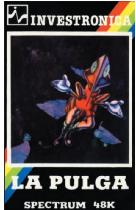
Figura 4. Carátula de distribución española de “Bugaboo” (1983).

A principios del año 1984 sale al mercado británico el videojuego “Fred”, que mantiene el entusiasmo internacional por